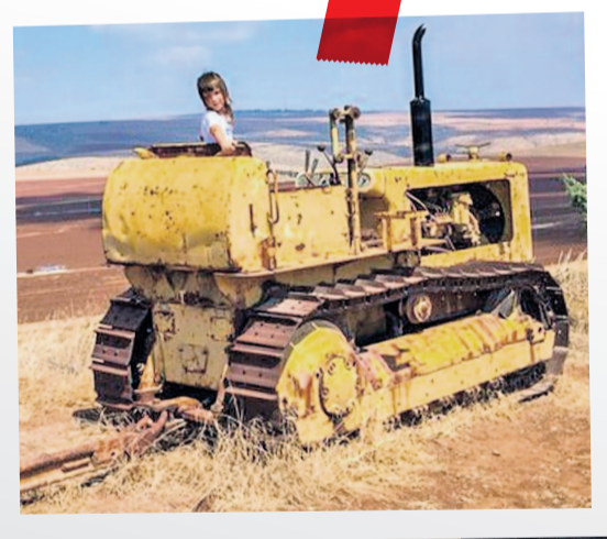
כביש חורפיש-מירון. הטיול האחרון עם סבא. סתיו 2002

אנו משוטטים באוטו לאורכה של דרך נוף רמות יששכר. מעט צפונה מקיבוץ בית השיטה פוגשים קטרפילר D4 עתיק-עתיק שהוצב שם לכבודם של חקלאי עמק חרוד - "גבעת הפלאחים" כונה המקום. יש לי באוסף בדיוק כזה טרקטור וסבא נוהג בו בשדות מעוז חיים - עשרה ק"מ מזרחית לשם. אני מתחנן בפני בני שיעלה על הטרקטור ויעשה בדיוק מה שאני מבקש. הוא בצדק לא אוהב לשחק בצילומים וגם דעתי אינה נוחה משחזור מהונדס כזה. ויש עוד בעיה. אין בידי את התמונה