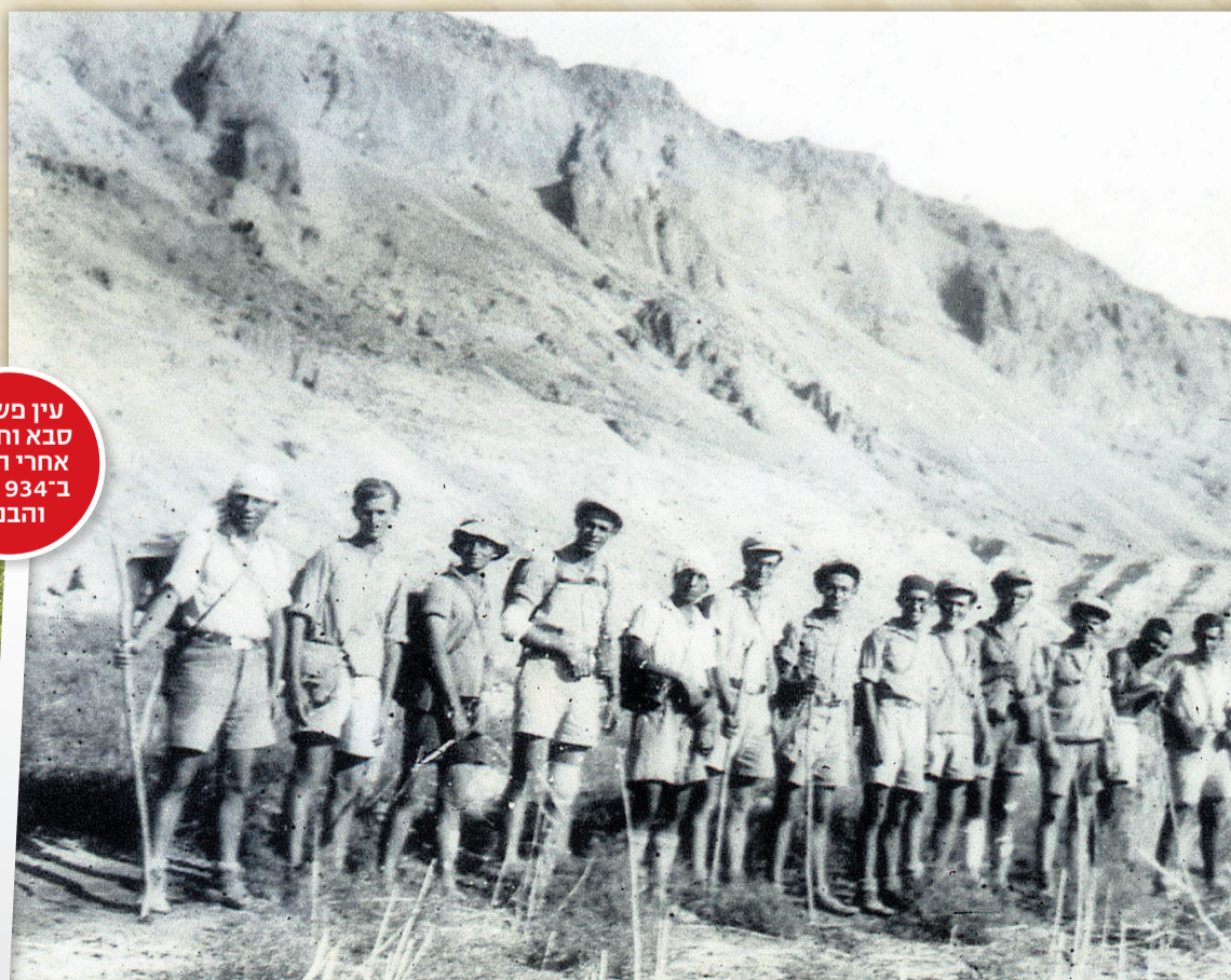
עין משחה. סבא וחברים אחרי הטיול ב־1934. אני והבנות