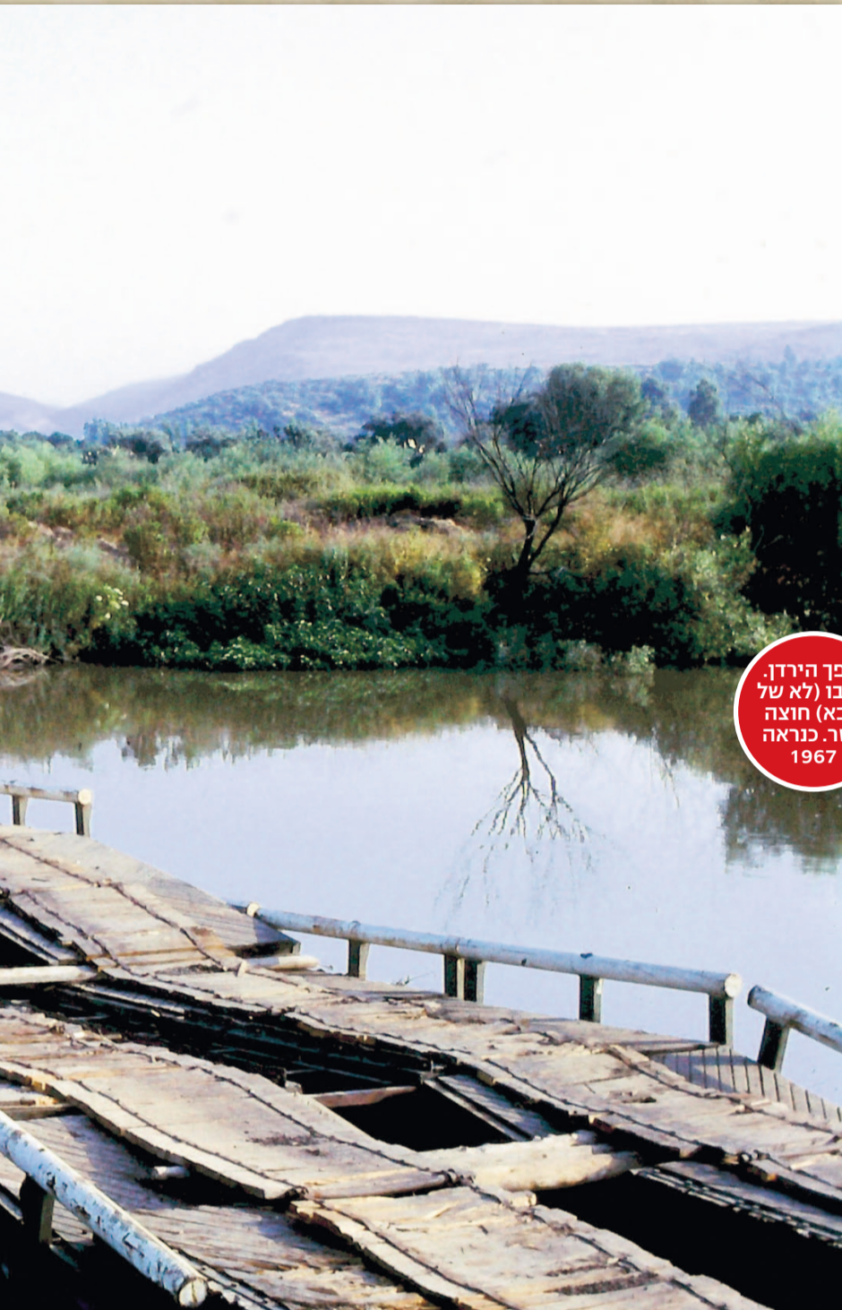
שפך הירדן. וולבו (לא של סבא) חוצה גשר. כנראה 1967