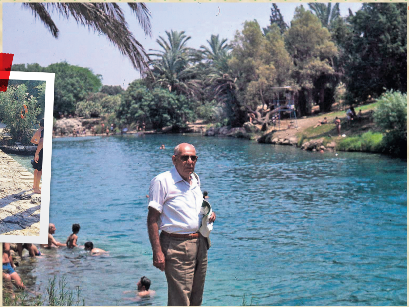
הסתנה. עומדים בדיוק איפה שבא עמד על הסכר באמצע הגן